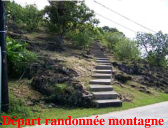
Départ randonnée montagne